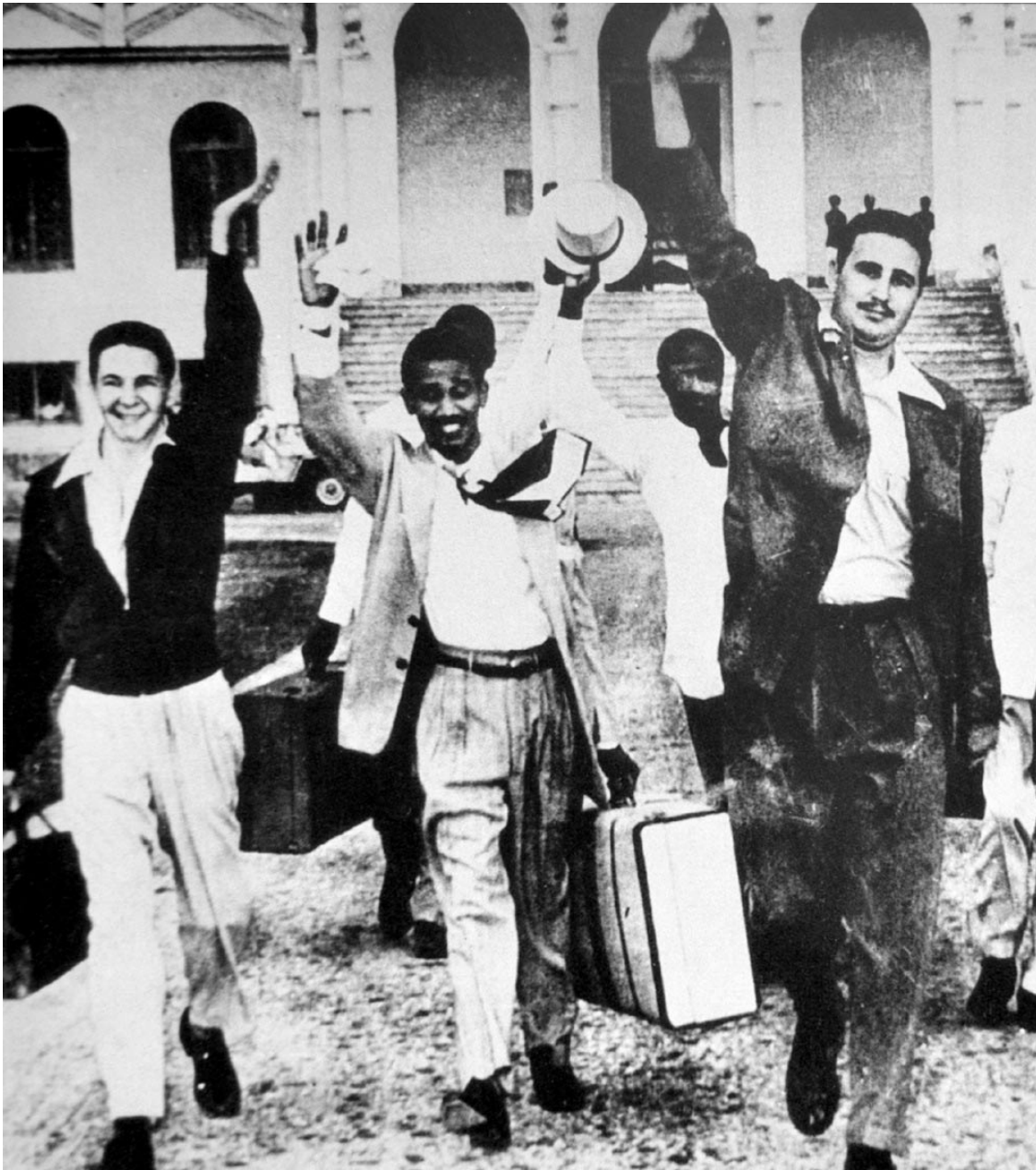
Fidel Castro (till höger) vid frigivningen den 15 maj 1955 ur fängelset på Isla de Piños (senare kallad Ungdomsön). Till vänster Fidels yngre bror Raúl Castro och i mitten Juan Almeida.