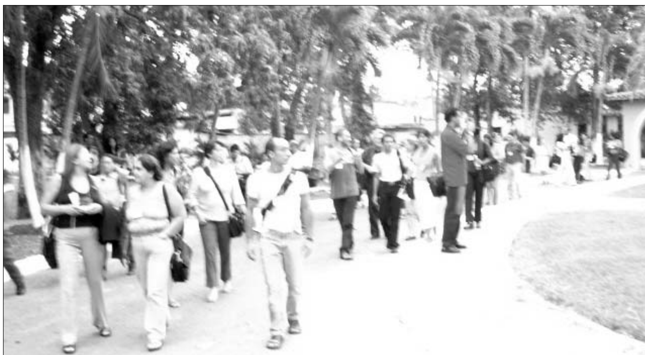
AIDS-sanatoriet i Santiago de las Vegas, vad döljer sig männe bakom dess väggar?