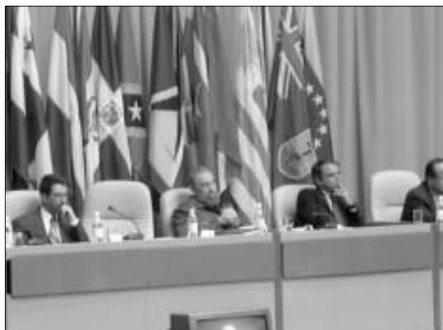
Forum 2003 invigs av Fidel Castro och Peter Piot

Under den tid patienten är inlagd kan han/hon utan problem lämna vårdinrättningen för att besöka sina anhöriga eller få besök om han/hon så önskar. Det finns 13 sanatorier på Kuba, utspridda över hela landet och snart invigs det fjortonde centret för hiv-positiva på Isla de la Juventud. I huvudstaden Havanna finns det fyra sanatorier