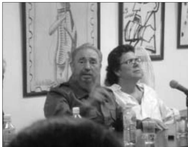
Fidel Castro vid sidan av kulturministern Abel Prieto, på Kulturarbetarförbundet.

Den demokrati som råder i världen är en stor bluff, sade Fidel Castro. Den så kallade pressfriheten fyller långtifrån kraven på verklig demokrati. Det är de stora transnationella bolagens intressen som styr världen, framhöll han. På Kuba står de revolutionära krafter som har sina rötter hos folket enade, en enighet som har bestått från första början fram till idag, och det är det som gjort det möjligt att genomföra revolutionens alla sociala satsningar.