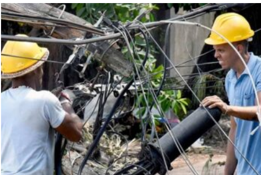
Orkanen Ian.