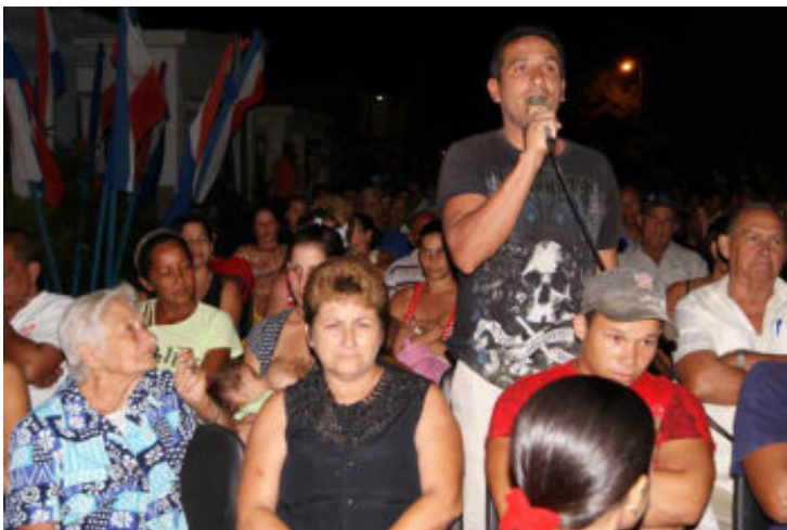
Kubas deltagardemokrati i praktiken.

Vid revolutionens triumf var Fidel och den revolutionära ledningen övertygade om att den representativa demokratin inte skyddade folkets intressen och behov, men de hade ännu inte någon klar uppfattning om vilka alternativa strukturer som borde utvecklas. De inledde processen med politisk återuppbyggnad genom att utveckla massorganisationer som skulle möjliggöra folkets aktiva deltagande i utformningen av det revolutionära projektet. År 1960 bildades kommittéer för revolutionens försvar i alla stadsdelar, med syftet att övervaka sabotage och terroristaktiviteter. Samtidigt tog revolutionära ledare från gräsrotsnivå kontrollen över Kubanska arbetareförbundet och Kubanska studentförbundet, som tidigare kontrollerades av ledare med kopplingar till den neokoloniala ordningen, och dessa nationella organisationer för arbetare och studenter växte i antal. 1961 organiserades småbönderna i Nationella organisationen för små jordbrukare, och Kubanska kvinnoförbundet bildades.