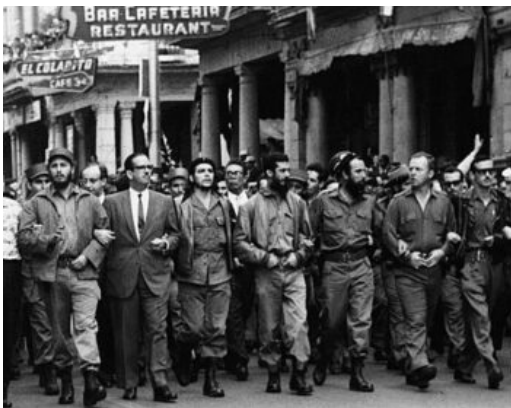
Dagen efter attentatet. Den kubanska statsledningen i en minnesmarsch för offren.