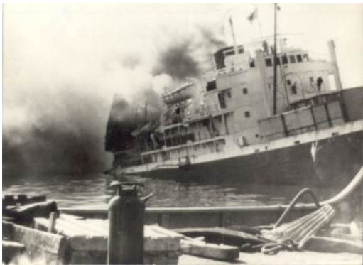
La Coubre efter sprängningen

* Det franska lastfartyget La Coubre sprängdes i Havannas hamn 4 mars 1960. Det var lastat med granater och ammunition från Belgien till Kuba, där revolutionen segrat några månader tidigare. Närmare 100 personer dödades och många skadades. Att det rörde sig om sabotage från USA var de flesta överens om, även om USA, föga överraskande, nekade.