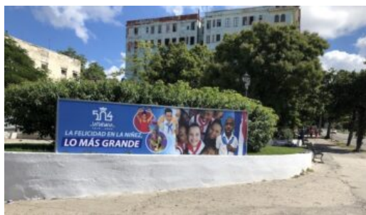
Barnens lycka a?r den sto?rsta.

Ändå har varken Trump- eller Biden-administrationen förbjudit amerikanska företag att sälja Parkinson-medicin till Kuba. Sanktionerna mot Kuba tillåter till och med formellt ?undantag och tillstånd som rör export av livsmedel [och] medicin?. Och 2022 införde Bidens finansdepartement ?generella licenser? för livräddande varor på Kuba, med argumentet att ?tillhandahållandet av humanitärt stöd för att lindra lidandet för utsatta befolkningar är centralt för våra amerikanska värderingar?.