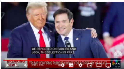
Donald Trump med Marco Rubio.

Enligt tidigare tjänstemän inom underrättelsetjänsten och utrikesdepartementet har USAs underrättelsetjänst under de senaste tre decennierna gjort bedömningen att ön inte har stöttat något som ens USA skulle definiera som terrorism sedan 1990-talet. När Obama tog bort ön från listan 2015 twittrade Ben Rhodes, administrationens kontaktperson för Kuba: ?Enkelt uttryckt, POTUS agerar för att ta bort #Cuba från listan över stater som sponsrar terrorism eftersom Kuba inte är en stat som sponsrar terrorism.?