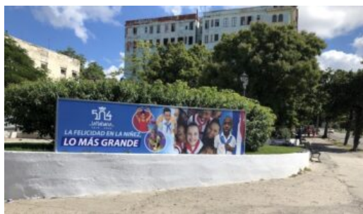
Barnens lycka är den största.

Ändå har varken Trump- eller Biden-administrationen förbjudit amerikanska företag att sälja Parkinson-medicin till Kuba. Sanktionerna mot Kuba tillåter till och med formellt ?undantag och tillstånd som rör export av livsmedel [och] medicin?. Och 2022 införde Bidens finansdepartement ?generella licenser? för livräddande varor på Kuba, med argumentet att ?tillhandahållandet av humanitärt stöd för att lindra lidandet för utsatta befolkningar är centralt för våra amerikanska värderingar?.