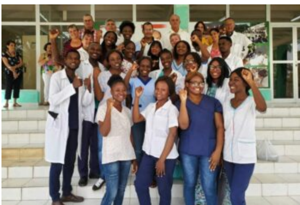
Studenter från ELAM