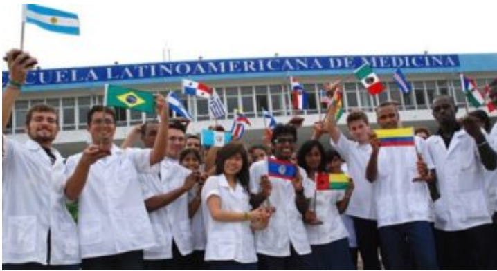
Studenter från olika länder på den Medicinska högskolan ELAM i Havanna