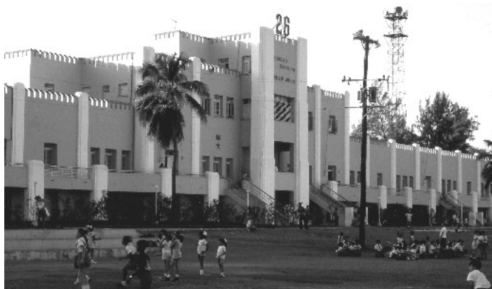
Moncadakasernen i Santiago de Cuba, som Fidel Castro och hans kamrater attackerade tidigt på morgonen den 26 juli 1953. Idag är kasernen ombyggd till skola och museum.

Ortodoxa Partiets ledare Chibás insåg hotet om militärkupp. I en sista desperat handling sköt han sig själv i huvudet och tog sitt eget liv 1951 mitt under ett radiotal till folket.