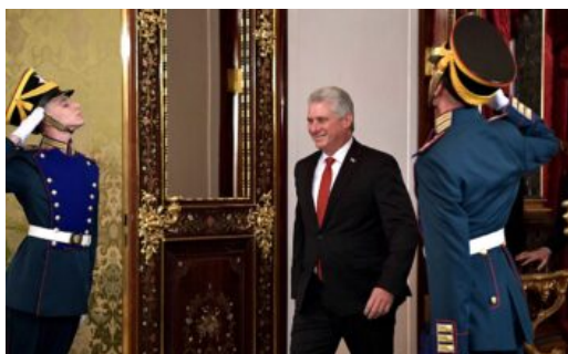
Miguel Diaz-Canel i Kreml.

Sergei Lavrov om förbindelserna med Kuba - Utdrag ur artikel från av Rysslands utrikesminister