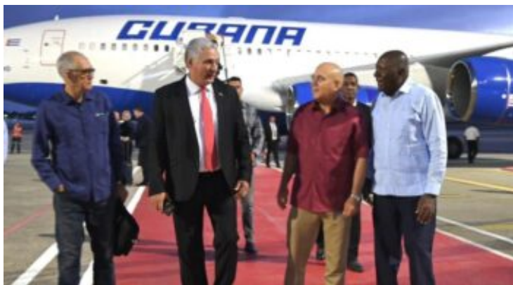
Kubas president vid återkomsten till Havanna.

Dagarna runt firandet ägnades åt flera toppmöten. Kuba slöt nya samarbetsavtal med Ryssland och med Venezuela. President Díaz-Canel hade också möten med bland andra Kinas Xi Jinping. Burkina Fasos radikale ledare, Traore, hade möten med en rad ledare och stärkte sina band med dessa. Det delvis som svar på att USA och Frankrike genomfört flera kupp- och mordförsök mot honom.