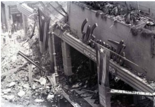
Varuhuset El Encanto efter attentatet

13 april 1961 utfördes ett attentat mot landets största varuhus. Det låg i centrala Havanna. En arbetare omkom, hela fastigheten förstördes, liksom många bostäder i närheten. Detta skedde i upptakten till invasionen av Grisbukten.