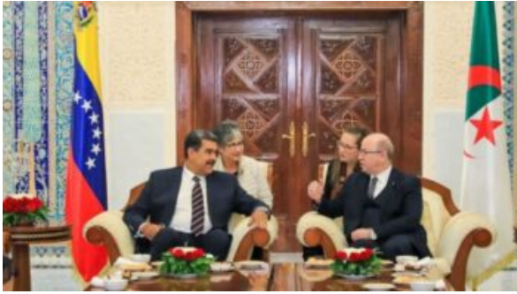
Nicolás Maduro i Algeriet.